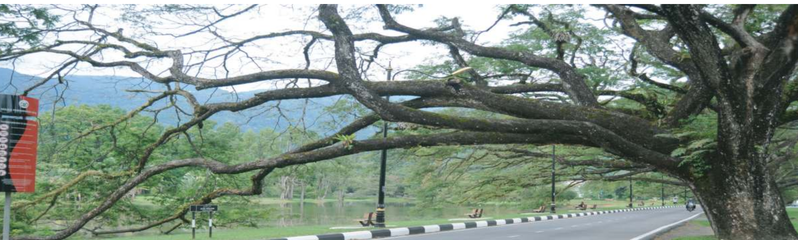
Taman Tasik Taiping, Perak