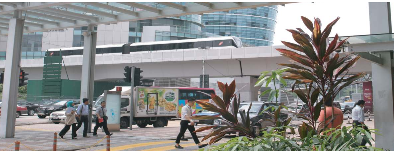
KL Sentral, Kuala Lumpur

Mampan dalam DPN2 meliputi aspek fizikal, alam sekitar, sosial dan juga ekonomi. Bandar Mampan yang dimaksudkan ialah pembangunan fizikal sesebuah bandar yang dilaksanakan secara optimum berdasarkan kepada keperluan penduduknya tanpa mengabaikan aspek kawalan alam sekitar yang mana faedah dari pembangunan dan perkembangan ekonomi bandar tersebut dapat dirasakan oleh semua golongan masyarakat termasuk golongan kanak-kanak, golongan belia, warga emas dan juga orang kurang upaya (OKU) yang hidup dalam suasana yang harmoni dan bersatu padu.