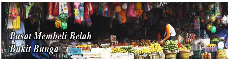
Pusat Membeli Belah Bukit Bunga

Cadangan Pembangunan Semula Kompleks Niaga Bukit Bunga Pusat IKS Mukim Maka Tapak pelupusan sampah Kg. Bendang Keladi Rumah mampu milik di Tanah Merah & Bukit Bunga Tebatan banjir Sg. Maka, Sg. Alor Jaba, Sg. Kepat, Sg. Manal, Sg. Tualang Bah & Sg. Kelantan Loji rawatan kumbahan berpusat di Bandar Tanah Merah dan Bukit Bunga Tanah Merah Central Ternakan Burung Walit di Pusat Bandar Tanah Merah