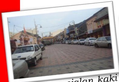
Laluan pejalan kaki